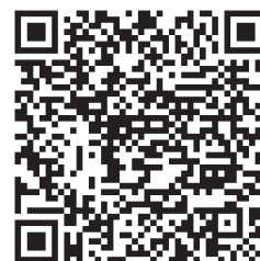
美濃國山城トレイル100 走行ルートマップ (GoogleMAP)

小島コミュニティセンター/朝鳥公園/城山公園/北方城址/仁坂坂峠/西ノ山/東ノ山/揖斐・城ヶ峰/小野坂峠/牛洞坂/野村山/花立峠/野村城(大谷山)/滝谷山/雁又山/金尾滝/大野橋/道の駅 織部の里/毘沙門天堂/山口城(文殊山)/祐向山/三甲スタジアム/網代山/則松球場/御望山/石谷/城田寺城(城ヶ峰)/ときわトンネルドリーム/諏訪神社/西峰頂上/百々ヶ峰/権現山/百々ヶ峰下山口/千鳥橋(歩行者用階段)/兎走山/鍋坂峠/岩田山/舟伏山/西山/めい想の小径分岐/馬ノ背分岐/馬ノ背登山道/岐阜城/金華山御嶽神社/金華山リス村/大手道/七曲峠/岩戸公園北駐車場/鷹巣山/洞山/野一色権現山/三峰山山頂/三峰山分岐/伊吹の滝/北山展望台/各務原権現山/北山/老洞峠/芥見権現山/桐谷坂峠/向山/向山見晴台/須衛山/金山/大岩見晴台/迫間不動極楽茶屋/迫間城跡/明王山 展望台/猿啄城展望台/北野天満宮・御嶽大黒天/猿啄城展望台 駐車場/坂祝駅